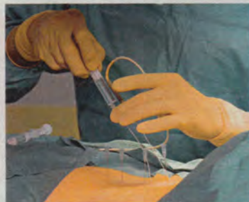
Mit Hilfe der Hitzesonde wird der Schmerz gezielt ausgeschaltet

Der Mikrolaser ist ideal für schwer zugängliche Bereiche an Hals- und Lendenwirbelsäule. In der feinen Punktionsnadel steckt eine dünne Glasfaser, die den Laserstrahl in die betroffene Bandscheibe weiterleitet und ausgetretenes Gewebe schrumpft.