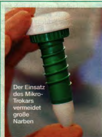
Der Einsatz des Mikro-Trokars vermeidet große Narben

Nachdem eine weitere Operation und anschließende Reha keinen Erfolg brachten, blieb laut ärztlicher Aussage nur noch die komplette Versteifung der Wirbelsäule, allerdings ohne Aussicht auf Beschwerdefreiheit. Als sie ablehnte, hieß es: „Dann kann man nichts mehr machen. Gewöhnen Sie sich daran.“ Schmerzen und Nebenwirkungen der starken Medikamente veränderten die Persönlichkeit der